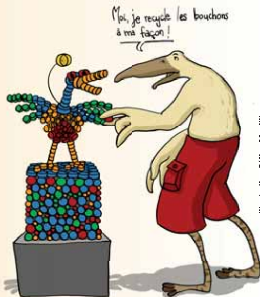
Illustration Céline Manillier

Réponses : A/ 2/ ; B/ 1 ; C/ 1 ; D/ 2 : Non, ils sont à déposer dans le bac d'ordures ménagères.